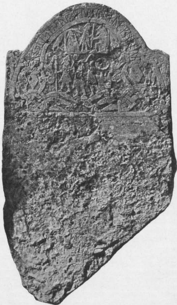
Fig. 15. Sanda-stenen efter fotografi.