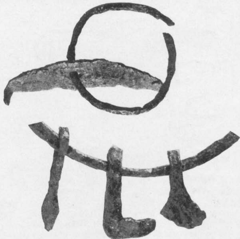
Fig. 19. Ur Torvalla-fyndet. \frac{1}{4} .

Det är säkert, att Odin efter nordisk föreställning var en spjutgud, det får betraktas som tämligen sannolikt, att Fröj stundom blivit