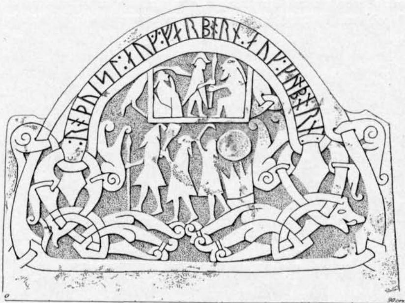
Fig. 17. Sanda-reliefen (teckning av O. Sörling i V. H. A. A.s ark.).

som medgives av konstnärens horror vacui i fråga om ornamentik, är den övre gruppen innesluten inom ett strängt begränsat rum. Detta rum erinrar så väl genom sin form som sin höga placering påfallande om de teckningar å Tjängvide-stenen och den stora Ardre-stenen, vilka gemenligen anses beteckna ett dödsrike. Att det även i detta fall är fråga om ett Valhall, där spjutgu-